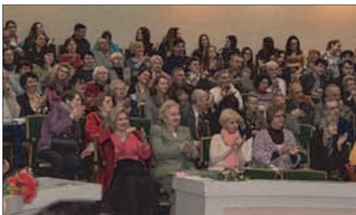
ФРАГМЕНТ ГЛЯДАЦЬКОГО ЗАЛУ КИЇВСЬКОГО МІСЬКОГО БУДИНКУ ВЧИТЕЛЯ. ВЕЧІР «САД БОЖЕСТВЕННИХ ПІСЕНЬ», 20 КВІТНЯ 2016 Р.

Ось його лист до свого учня Михайла Ковалінського: «Найдорожчий друже Михайле! Дехто, як каже Сократ, живе, щоб їсти й пити, а ж навпаки – їм, щоб жити. Хоч більшість зовсім не знає, що значить жити, об'їдаються м'ясом і обпиваються різними хмільними напоями. Тому найважливе мистецтво – навчитися жити... Ми уникаємо хворих тілом, щоб вони не могли нас заразити різними хворобами, але охоче підтримуємо