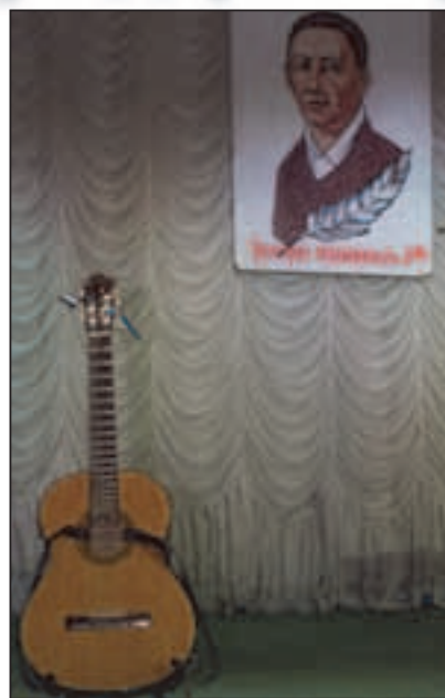
На сцені Київського міського будинку вчителя, 20 квітня 2016 р.